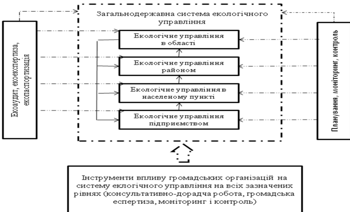
Рис. 2. Модель системи загальнодержавного екологічного управління

Констатовано, що питання “екологічного управління” і “систем екологічного управління” посіли чільне місце в державно-управлінських процесах багатьох розвинених країн. В Україні процес переходу до екологічного управління та його впровадження на всіх управлінських рівнях перебуває на початковому етапі. Запропоновано модель системи загальнодержавного екологічного управління, що передбачає запровадження ієрархії екологічного управління, починаючи з рівня окремого підприємства до найвищого – загальнодержавного рівня (рис. 2). Важливу роль у цій моделі відіграють екологічний аудит, експертиза, паспортизація, моніторинг, планування та контроль.